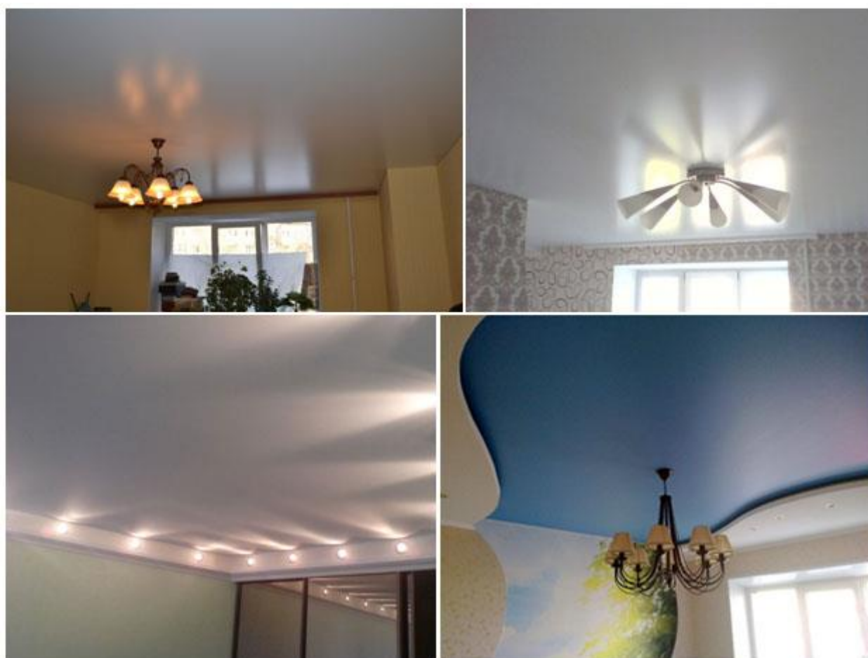
Фото 4. Сатиновые натяжные потолки