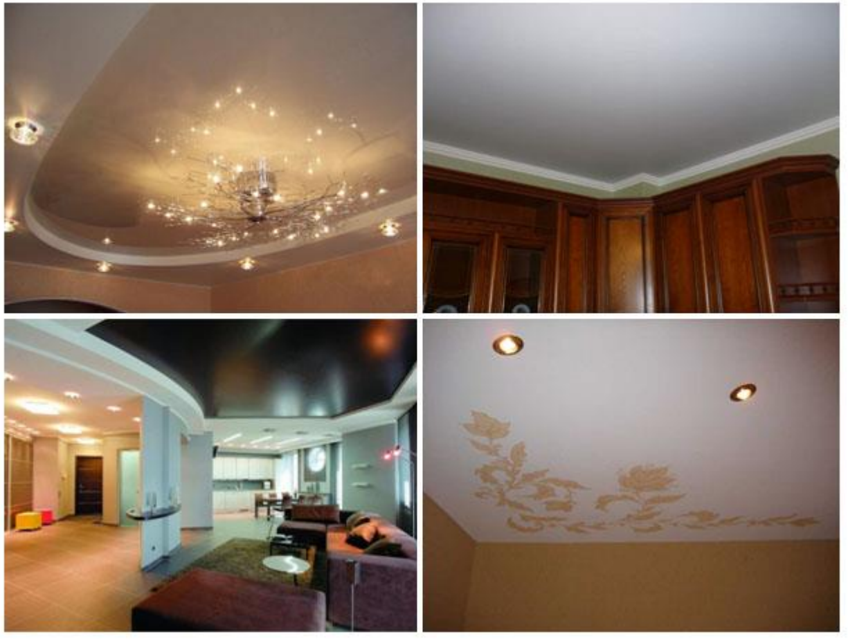
Фото 3. Матовые натяжные потолки

Матовый натяжной потолок больше всего смотрится в больших прямоугольных комнатах и помещениях. Матовая поверхность, как известно не создает бликов, не искажает цвет и оттенок полотна при попадании на него различного рода света (естественного или искусственного). Технические характеристики матовых полотен те же, что и для глянцевых ПВХ полотен.